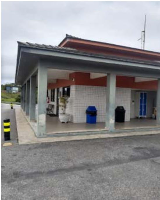
Figura 13 – Base Operacional - Km 40. Foto de: 29/06/2021

Foi realizada visita ao posto de atendimento do Km 40 em Araruama, onde a concessionária atende previamente à Resolução AGETRANSP Nº 46.