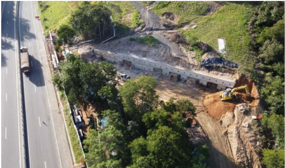
Figura 5 – Vista Superior do Talude - Km 15,7. Foto do processo SEI-220008/002097/2020