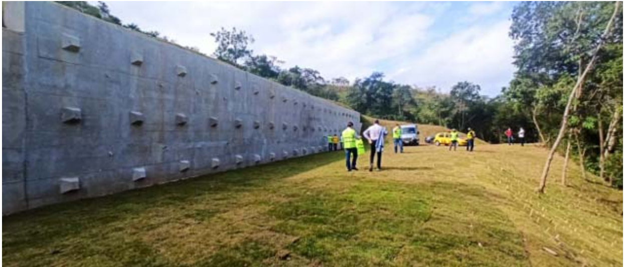
Figura 8 – Km 15,7 - Rio Bonito. Foto de: 29/06/2021