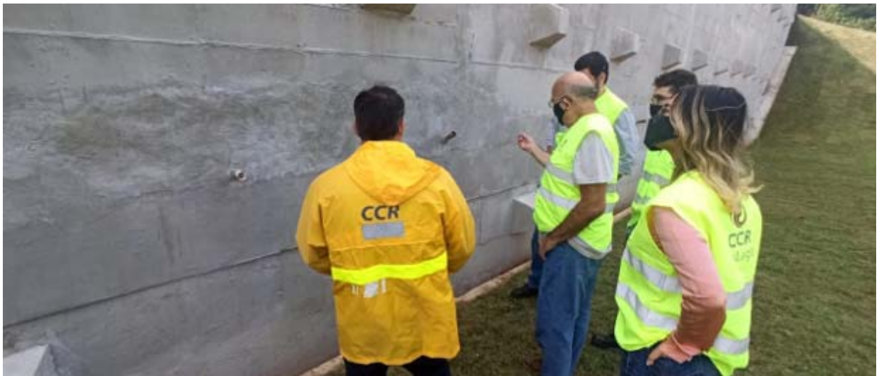
Figura 9 – Km 15,7 - Rio Bonito. Foto de: 29/06/2021