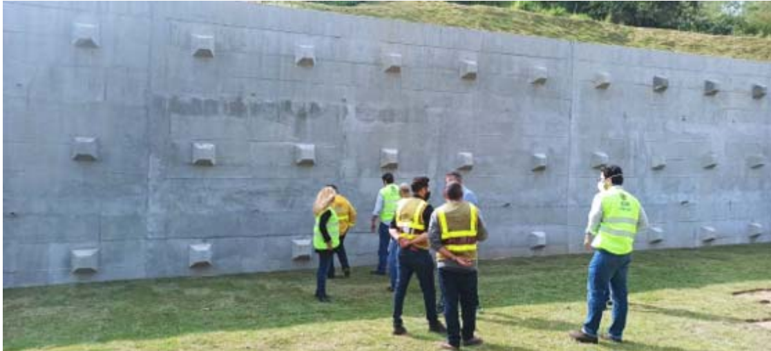
Figura 4 – Km 15,7 - Rio Bonito. Foto de: 29/06/2021

Em 29/06/2021 foi realizada vistoria in loco no Km 15,7, local onde ocorreu a obra de contenção do talude pelos colaboradores desta AGETRANS, DER e da CCR.