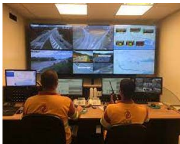
Figura 11 – Visita ao CCO - Km 22. Foto de: 29/06/2021