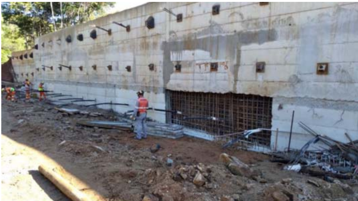
Figura 3 – Escavação da Cortina Atirantada B - Km 15,7. Foto do processo SEI-220008/002097/2020