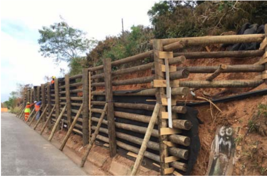
Figura 2 – Escavação da Cortina Atirantada A – Km 15,7.