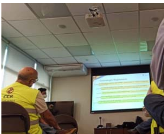
Figura 10 – Apresentação Sobre a Obra de Contenção. Foto de: 29/06/2021

Foi realizada visita à sede administrativa da CCR Via Lagos, onde ocorreu apresentação sobre a obra de contenção do talude do Km 15,7, e ao Centro de Controle Operacional (CCO).