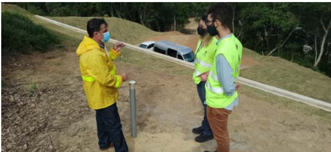
Figura 5 – Km 15,7 - Rio Bonito. Foto de: 29/06/2021