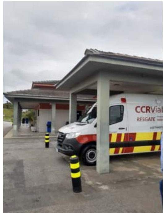
Figura 14 – Base Operacional - Km 40. Foto de: 29/06/2021