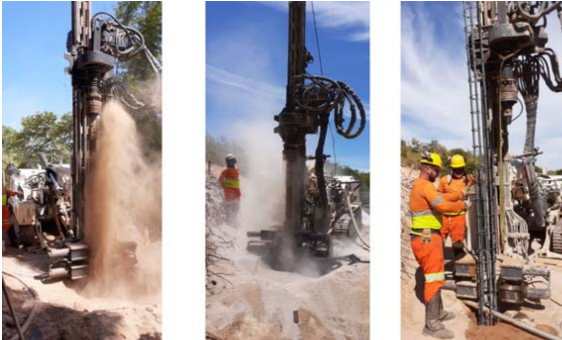
Figura 4 – Execução da Estaca Raiz - Km 15,7. Foto do processo SEI-220008/002097/2020