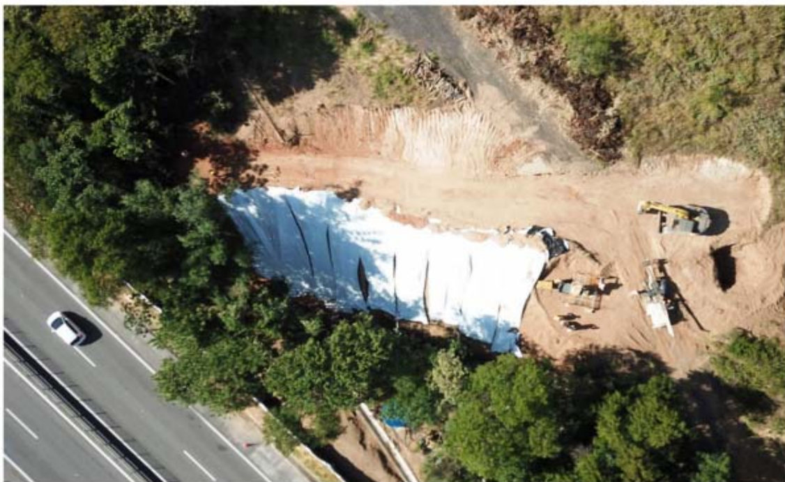
Figura 1 – Visão Aérea do Talude - Km 15,7. Foto do processo SEI-220008/002097/2020

A concessionária CCR Via Lagos realizou obra para estabilização Geotécnica do talude no Km 15+700 da Rodovia RJ-124 – Via Lagos, em Rio Bonito, na pista sentido Rio de Janeiro. O terreno se apresenta em trecho de declínio, parcialmente terraplanado, com talude em solo-rocha adjacente à rodovia. De acordo com o histórico local, o talude apresentava indicações de movimentações contínuas e com ocorrências de trincas na parte superior, motivos pelos quais necessitou da adoção das intervenções geotécnicas. Abaixo registro fotográfico da obra enviado pela concessionária através do processo SEI-220008/002097/2020.