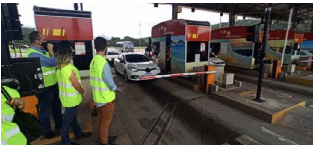
Figura 6 – Praça de Pedágio - Km 22. Foto de: 29/06/2021

Foi realizada apresentação da operação da praça de pedágio no Km 22 em Rio Bonito aos colaboradores desta AGETRANSP.